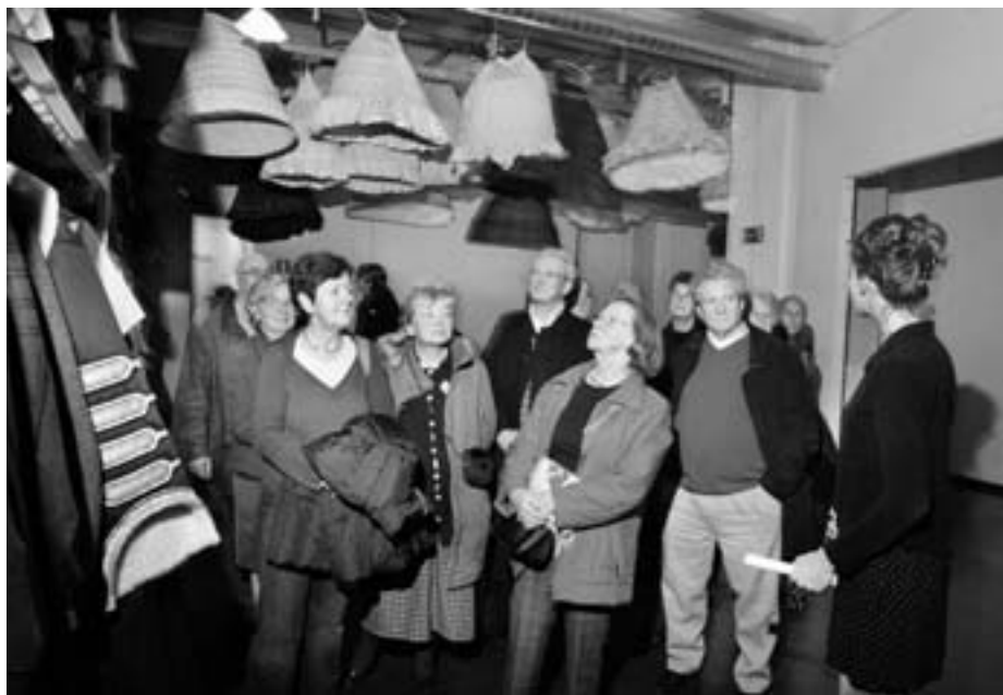
Le Théâtre royal de la Monnaie possède aussi des fonctions muséales.

Nous avons tous une idée plus ou moins précise de ce qu'est un musée. Pourtant, rien n'est plus compliqué que de rassembler sous une définition commune des institutions en mutation permanente et recoupant des réalités très diverses.