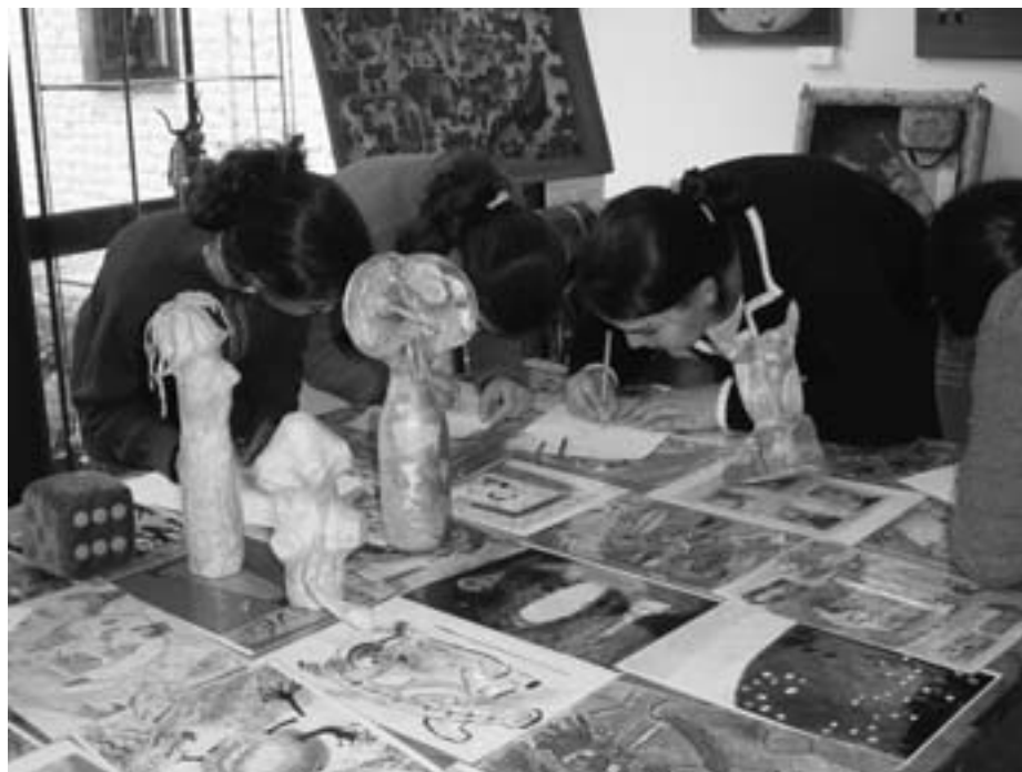
Jeu de l'oie au Musée d'Art spontané

Catherine. L'équipe du musée a développé un jeu de l'oie où les enfants doivent retrouver un tableau à partir de l'interprétation qu'en ont faite d'autres élèves. Chaque case du jeu comporte également des questions qui font appel à l'observation et à l'imagination. Même les petits se montrent très enthousiasmés par cette approche. Par le jeu, les enfants s'approprient le musée et spontanément, ils se mettent à discu-