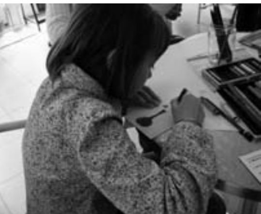
«Le printemps des musées», mai 2007, au Musée d'Ixelles.

L'accueil, l'information, voire la formation du public, sont entrés dans le champ d'action habituel du musée, parfois avec l'aide d'associations comme les Amis des Musées. Ce qui reste des services éducatifs de ce temps-là (!) – une fois intégrés au sein de l'institution – ressemble parfois davantage à un service de relations publiques. Assagis, assimilés, les services éducatifs servent alors une cause nouvelle: assurer la viabilité financière du musée via les recettes apportées par la fréquentation d'un plus large public et sa participation à des programmes d'activités.