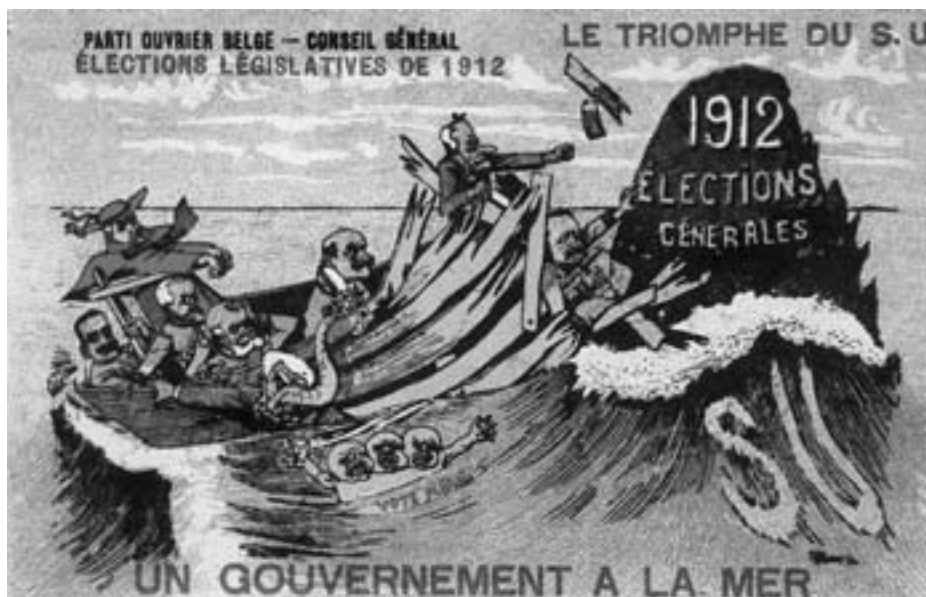
Affiche électorale du POB, élections législatives du 12 juin 1912, lithographie (Musée royal de Mariemont, Morlanwez)

Quelques considérations autour d'une exposition consacrée à l'histoire du droit de vote en Belgique