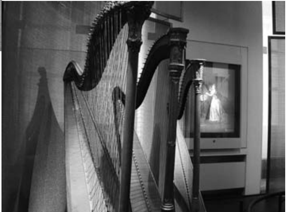
Le Musée des Instruments de Musique est un département des Musées royaux d'Art et d'Histoire