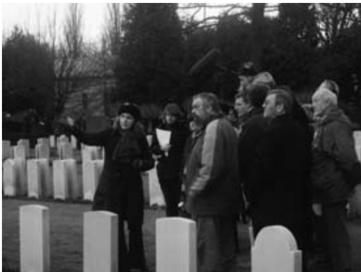
Dans le cadre d'une journée pédagogique, les professeurs découvrent quelques monuments commémoratifs de la guerre à Bruxelles