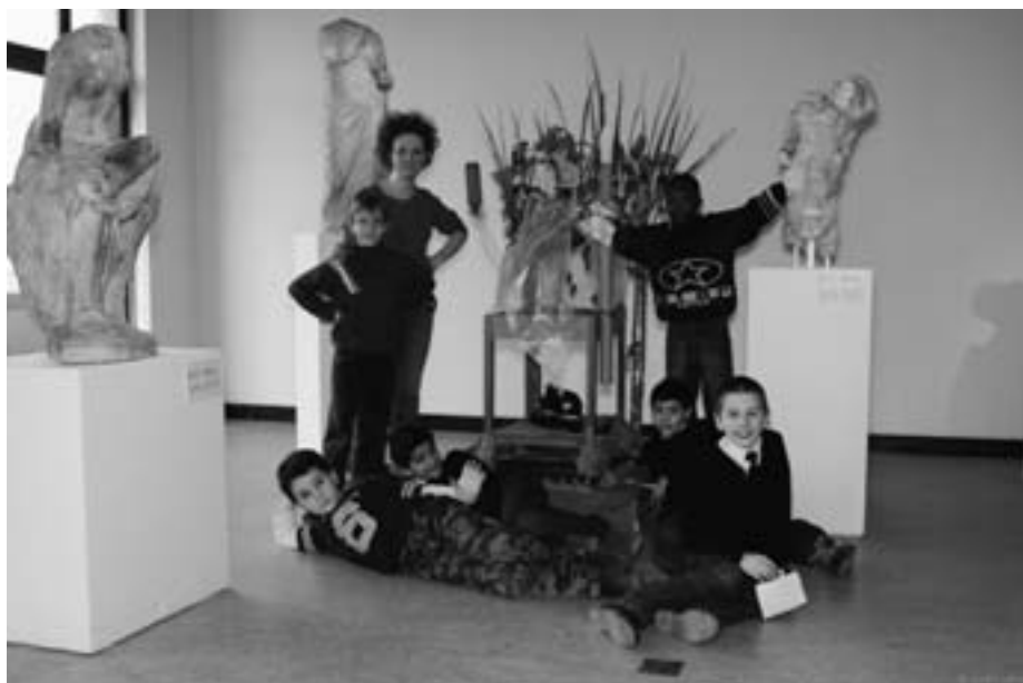
Le musée, pas seulement une source de connaissances

Comment guider les groupes scolaires dans les salles du musée d'une manière à la fois passionnante et actuelle? Nous nous posons cette question en permanence car nous avons l'ambition de rencontrer les attentes des professeurs et de leurs étudiants. Les guides-animatrices restent attentives aux programmes scolaires et aux souhaits des enseignants. Nous avons réorienté notre mission mais sans négliger la part d'imaginaire et d'émotion liés à la visite du musée. Nous cherchons à impliquer l'élève davantage dans la visite pour qu'il s'approprie les œuvres en cherchant lui-même, en développant son sens critique.