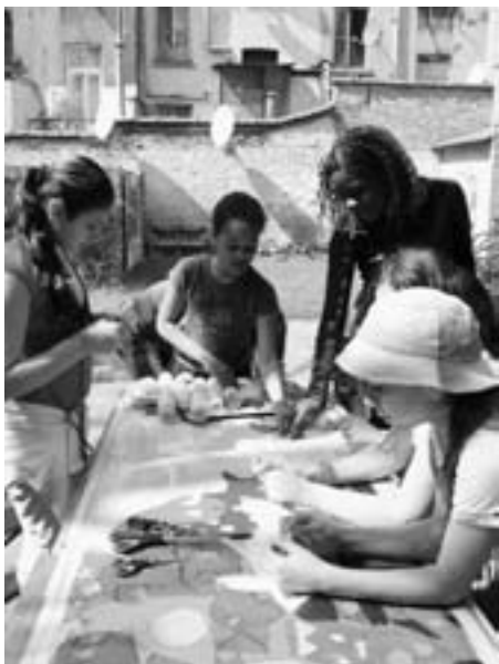
Création d'un faux vitrail. Projet Anim'Action 2006-2007

«Madame de morale, on va au musée cette année?» Pour les «moraliens» de Chazal et de la Vallée, les deux écoles fondamentales d'enseignement spécialisé de Schaerbeek (type 8 et type 1), les visites au Musée d'Art spontané 1 , sont presque devenues une partie intégrante du programme depuis trois ans.