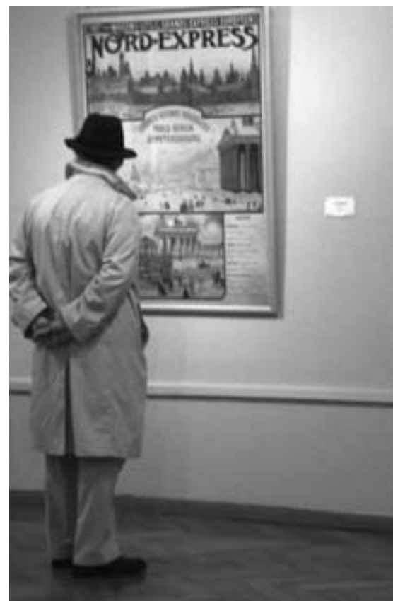
Musée d'Ixelles, été 2007.

Les visiteurs, et parmi eux les élèves, font «naturellement» partie des préoccupations de tout musée, à côté de celles qui concernent la conservation et l'étude. C'est pour les visiteurs que le musée présente et expose... Les visiteurs profitent de structures d'accueil; ils sont informés par une signalétique, des étiquettes, des panneaux informatifs..., par des publications, des catalogues, des dépliants...; ils bénéficient de visites guidées, de conférences... Dès lors, une question se pose: faut-il des services éducatifs?