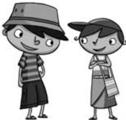
Tom & Charlotte, les deux mascottes des activités pour enfants du Conseil bruxellois des Musées