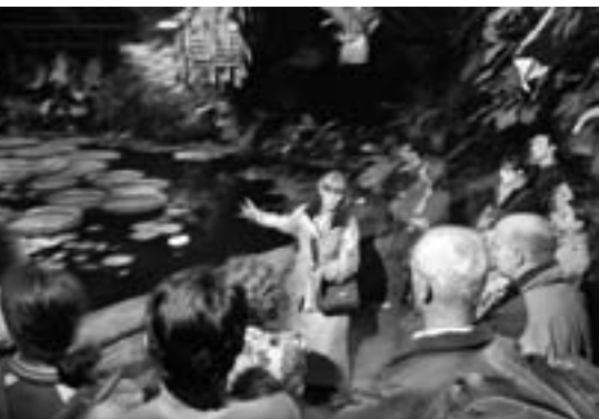
Une nocturne au Jardin botanique national de Belgique.

Les Nocturnes ne sont pas la seule initiative susceptible d'intéresser les enseignants.