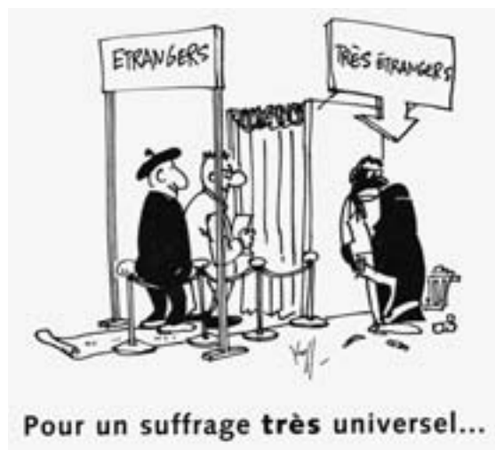
Affiche dessinée en 2002 par Pierre Kroll pour la Coordination nationale d'action pour la paix et la démocratie (CNAFD) à l'occasion d'une manifestation en faveur du suffrage des étrangers (CNAFD)

Mais le vote des étrangers était loin d'être le seul sujet de polémique. De la question du suffrage découle une quantité insoupçonnée de concepts et de notions clés du monde contemporain: nation, citoyenneté, démocratie, migrations... Si l'on veut être complet, il faut répondre à une liste interminable de questions: Qui possède le droit de vote? Qui ne l'a pas? Que représente ce droit? Quelles ont été les forces qui ont mené à tel ou tel élargissement du corps électoral? Qu'est-ce qu'un parti politique? Comment s'élabore une liste électorale? Quel mode de scrutin est-il le plus juste...? Mission impossible donc, d'autant plus que certaines de ces questions amenées de front risquaient à coup sûr de provoquer l'assoupissement de l'attention, sinon l'ennui.