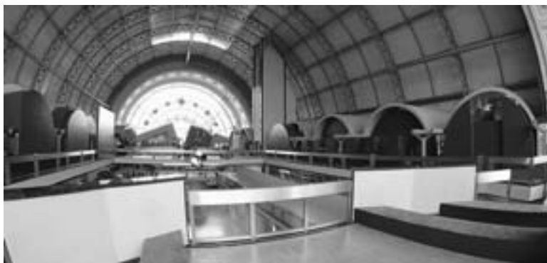
La nouvelle salle Seconde Guerre mondiale

Il est évident que l'atmosphère et la présentation de chaque salle conditionnent fortement notre offre pédagogique. Mais cette dernière a un autre obstacle à surmonter, à savoir le thème même de nos collections: la guerre. Nombre d'adultes sont persuadés que parler de la guerre revient à la glorifier et à exalter l'héroïsme des valeureux guerriers. Le plus grand défi que le service éducatif a eu à relever est de battre en brèche cette idée reçue solidement ancrée dans les esprits. C'est pourquoi nous avons multiplié les actions envers nos deux publics cibles, les enseignants et les enfants en diversifiant nos activités et nos thèmes. Le service éducatif propose des activités dans le cadre du programme scolaire (en histoire ou en éducation à la citoyenneté) et d'autres plus ludiques permettant de partir à la découverte des différentes collections. Bien au-delà de l'histoire-bataille et des explications techniques, les collections offrent la possibilité d'approcher l'expérience humaine des militaires et des civils pris dans l'engrenage de la guerre. Thèmes historiques, réflexions politiques, récits anecdotiques, évolutions technologiques, aspects humains, le Musée de l'Armée a plus d'un sujet dans son sac!