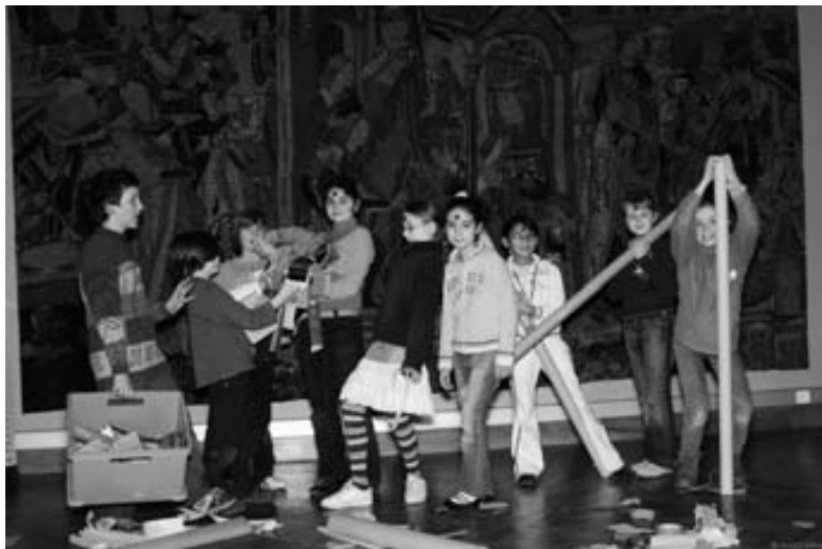
Se laisser ému par les œuvres

Ludiques et attrayantes, elles aident à mieux visualiser, à rendre plus concrètes certaines matières ou matériaux et à mieux comprendre les gestes ou les techniques (l'écriture, la pré-histoire, les Celtes et les Gallo-romains ou encore l'Égypte). Leur contenu offre une panoplie d'activités destinées à piquer la curiosité des enfants tout en élargissant l'horizon de leurs connaissances.