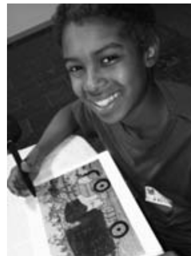
Les enfants constituent des visiteurs fidèles et enthousiastes.

Les enseignants sont régulièrement tenus au courant des activités et innovations du service éducatif grâce à l'envoi d'un bulletin semestriel et par la participation aux journées de formation qui présentent de nouvelles salles ou proposent des exploitations pédagogiques originales.