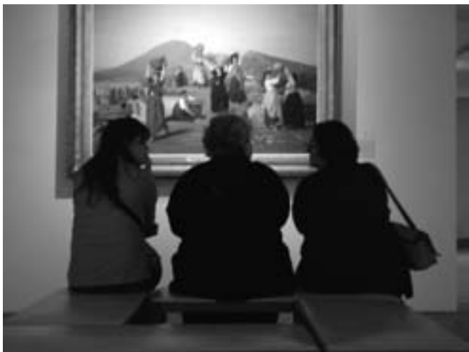
Musée d'Ixelles, novembre 2007.