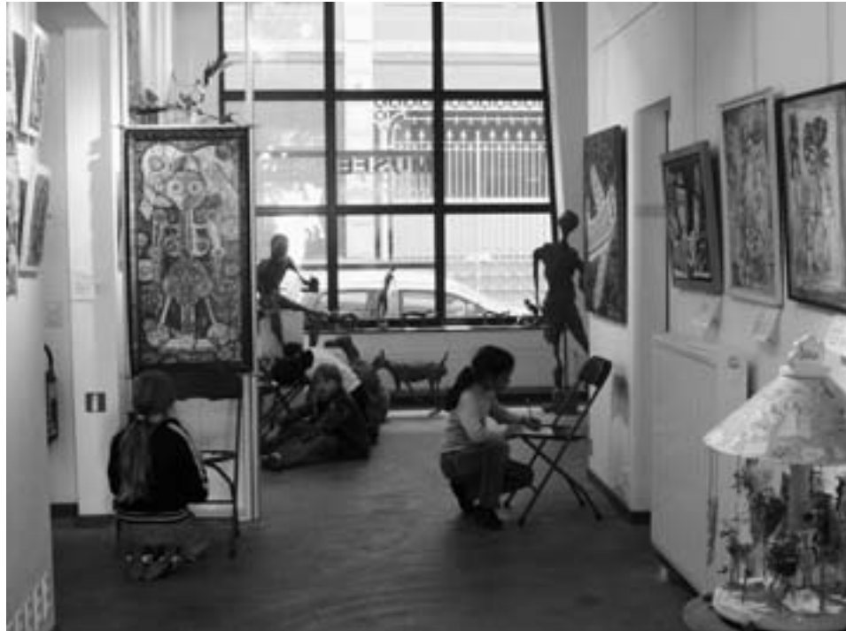
Activités au Musée d'Art spontané. Interprétation d'un tableau