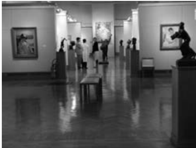
Un «Dimanche au Musée», Ixelles, printemps 2007

apaisés. Dans la foulée de ce mouvement, les services éducatifs se sont multipliés, de manière quasi internationale, et ont acquis une vitesse de croisière. Malgré tout, les musées n'ont-ils pas, au fil du temps, conservé de ce souci de rencontre des publics que ce qui leur semblait «politiquement correct»? Les projets éducatifs novateurs, perturbateurs ou dérangeants sont souvent externalisés vers des ateliers créatifs, des centres culturels, des services communaux, des associations... qui pour certains cherchent vaille que vaille un subventionnement.