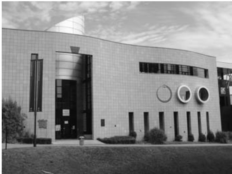
Le Musée de la Médecine fait partie du réseau des musées de l'ULB.