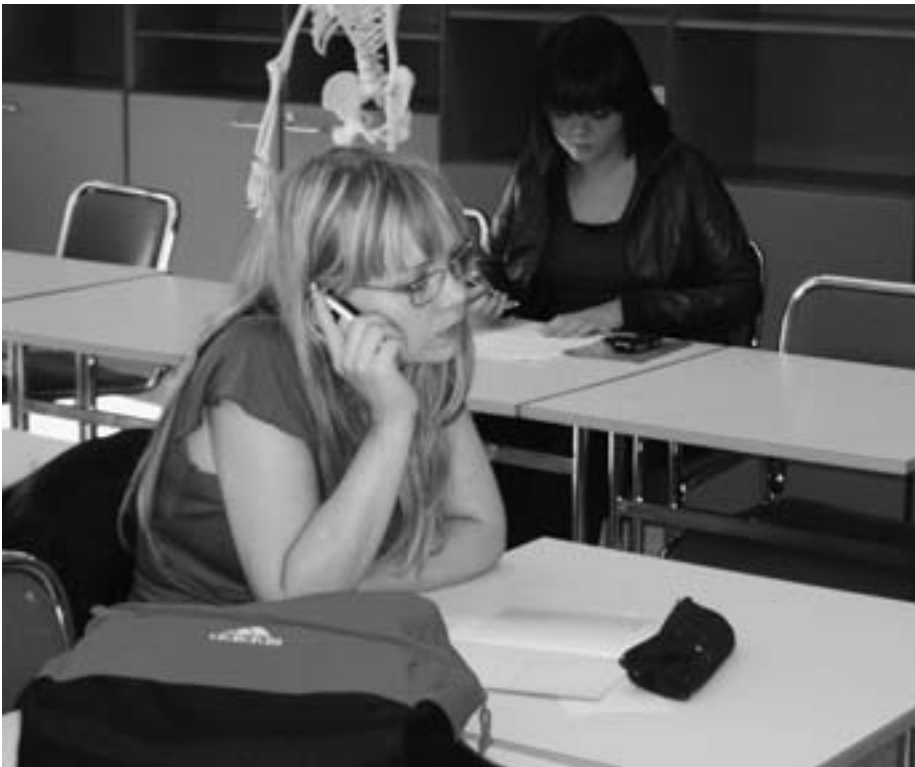
Le GSM en classe appelle le musée © National Gallery of Iceland