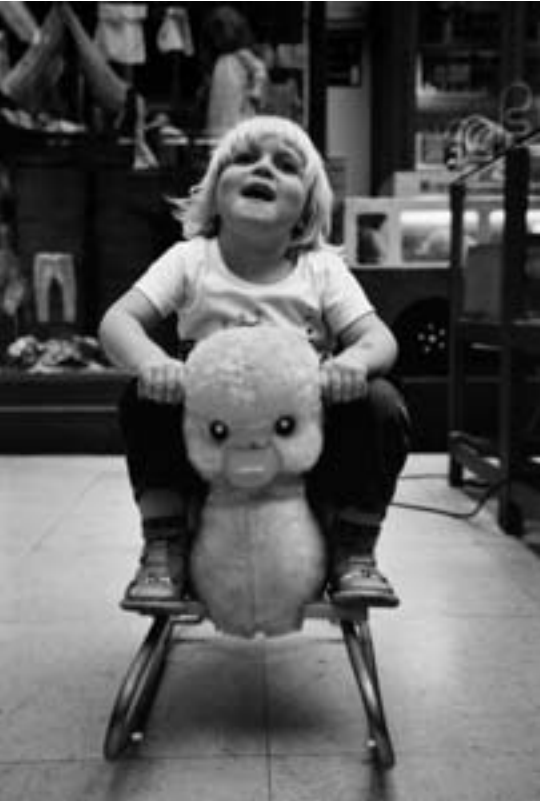
Le Musée du Jouet, un lieu accessible 365 jours par an grâce à l'énergie d'un conservateur passionné et d'une poignée de bénévoles.