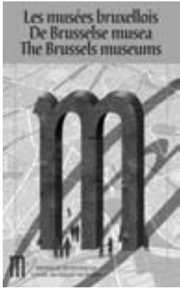
Le Plan des Musées bruxellois, une publication gratuite et bien utile.