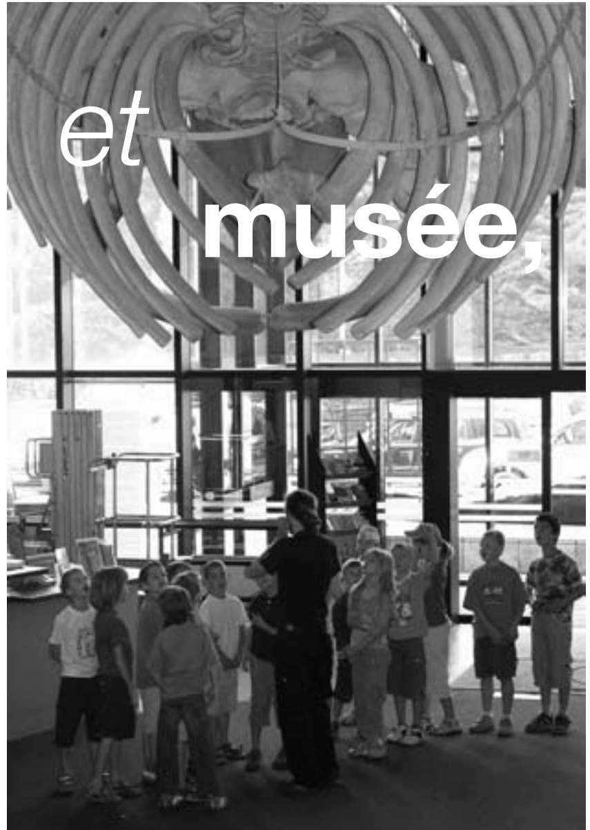
Sous la baleine... entrée du Muséum des Sciences naturelles