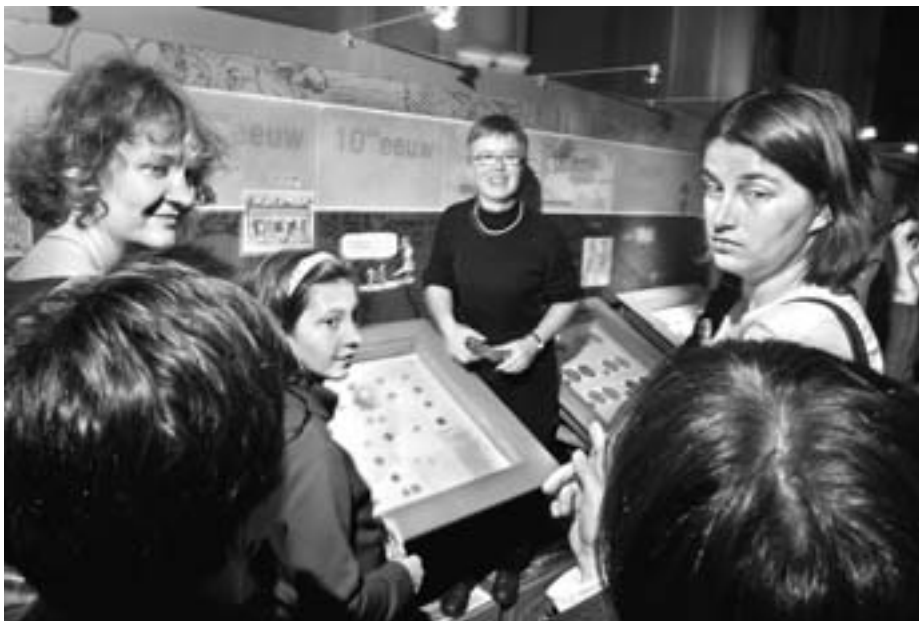
Visite guidée au Musée de la Banque nationale.